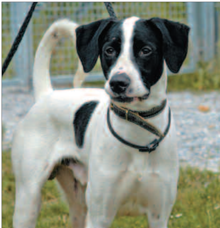
Es gibt „Hundetherapeuten“, die jede aufgestellte Rute „therapieren“ – denn sie beweise Dominanz des Hundes. Da ist einem wirklich zum „Schwanzeinziehen“ ...

Kehren wir an dieser Stelle zurück zu Mex & Co.. Zeigte Mex wirklich dominantes Verhalten, weil er seinen Platz im Bett plötzlich nicht mehr aufgeben wollte und auf die Zurechtweisung seines Besitzers seinerseits mit einer Zu-