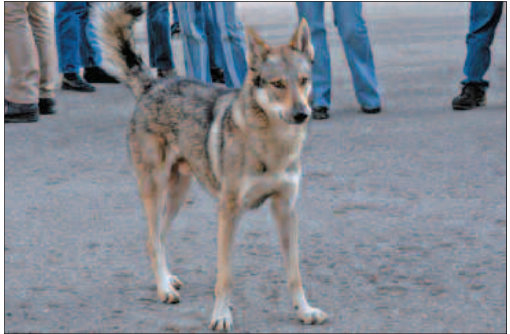
Bislang kaum wirklich hinterfragt: Begreift sich ein Hund wirklich als Teil eines Menschenrudels?

Ein anderer Hundeflüsterer in einer anderen Sendung behandelte einen jungen Dobermannrüden, der – allein gelassen – teure Teppiche und Möbel zerstörte. Seine