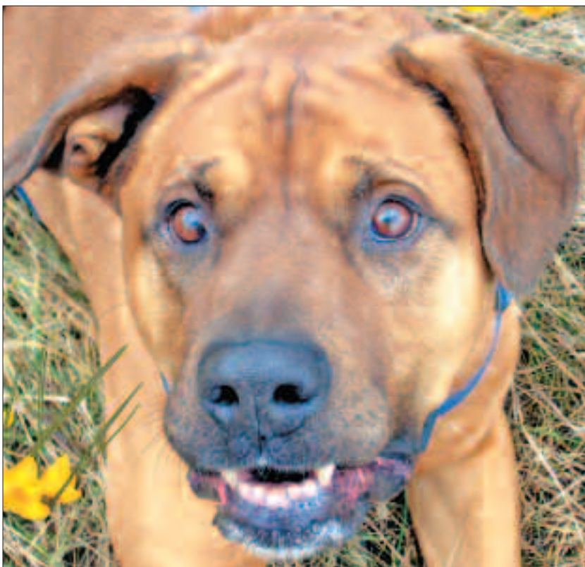
Tino, ein Boxermischlingsrüde, ist ein 8-j. souveräner und selbständiger Hund. Das hat nun aber nichts mit Dominanz zu tun. Im Tierheim Krems wartet er noch immer auf ein neues Zuhause (Tel. +43 (0)27321 84720)